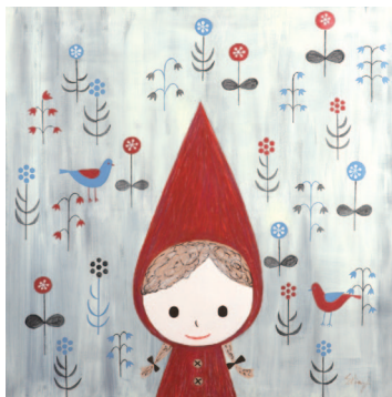
赤ずきん 花が咲いたよ(2011) Design by © Shinzi Katoh™ Licensed by © Copyrights Asia