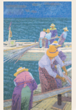
「瀬戸内のいわし網漁夫」1970年 油彩・キャンバス

本年度1回目の常設展では、瀬戸内の漁師や女性像など色鮮やかな作品を紹介します。この機会にぜひ尾崎のさまざまな色の世界をご堪能ください。