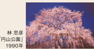
林忠彦 「円山公園」 1990年

周南市出身の写真家・林忠彦が、病魔と闘いながら最後のライフワークとして完成させた『東海道』。助手や多くの写友に支えられて撮影した、林の仕事への執念の結晶でもある作品が並びます。