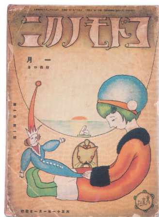
「コドモノクニ」第1巻第1号1922年1月号 イルフ画館蔵

「日本童画のパイオニア」と呼ばれる武井武雄。彼の多彩な創作活動を紹介します。優しさやユーモアに包まれた創造世界に触れてもらう展覧会です。童画だけでなく版画や玩具など、約250点を展示します。