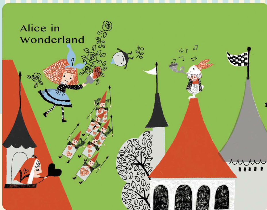
Alice in Wonderland