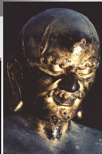
左：五百羅漢寺内部 右：羅怛羅尊者