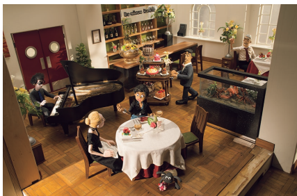
『映画 ひつじのショーン ~バック・トゥ・ザ・ホーム~』 大会場のレストラン 撮影用セットと小物、パペット

アーマチャー アトチームによる手作りです。ちなみに、この映画だとショーンの人形はだいたい20体ほど、人間の人は190体ほど作っています。実際の人の動きと似たような動作が出来るよう、人間の体には、写真のようアーマチャーと呼ばれる骨組みが使用され、球関節を用いてより繊細な動きが出来るようになっていきます。