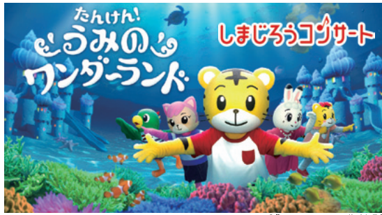
しまじろう