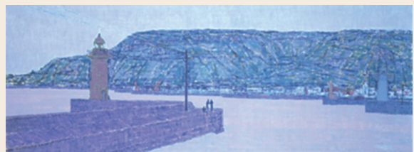
「赤い燈台(高松港)」 1984年 油彩・キャンパス