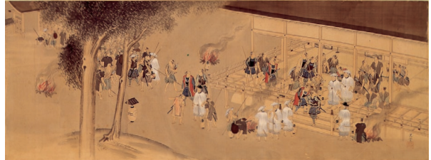
七卿落図(徳山毛利家蔵)

明治維新150年にあわせて、幕末から維新にかけての激動の時代に徳山藩主であった、毛利元蕃にスポットをあてて、その時代を資料とともに紹介しています。今回の展示内容は6/30(土)までです。