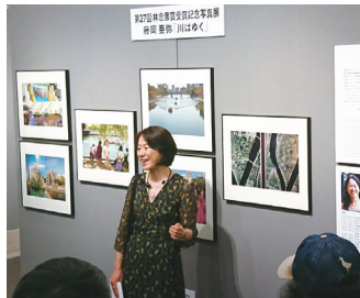
ギャラリートークのようす