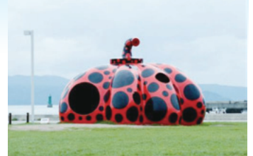
草間彌生「赤かぼちゃ」 2006年直島・宮浦港緑地