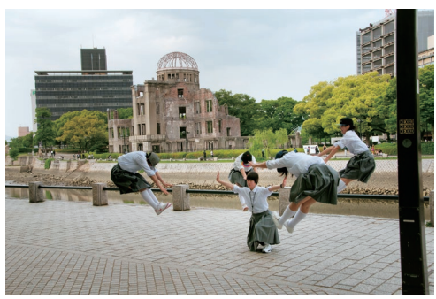
第27回(前回)受賞作「川はゆく」藤岡亜弥