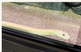
先月訪れた、岩国シロヘビの館にて。縁起が良いそうです。