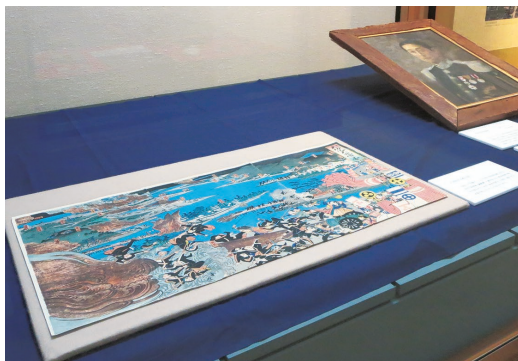
鳥羽・伏見の戦いの錦絵とその戦いに出陣した元功の肖像画