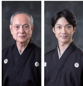
野村 万作(人間国宝) 野村 萬斎