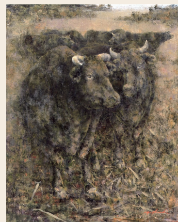
「里山の牛」2016年 油彩・キャンバス

中西 正レコードミニコンサート in 郷美 第9章 10月28日(日) 14:00~ “アナログレコードによるヒーリングコンサート” 正午からは入場無料 [演奏曲目] ジョージ・ウィンストン「カラズ/ダンス」ほか ピアノの音色で癒しのひとときを!