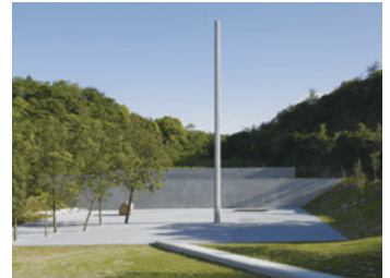
李禹煥美術館