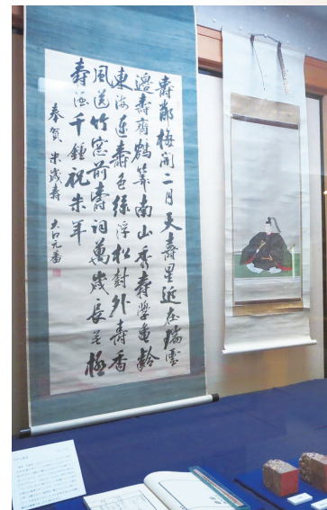
毛利元蕃の肖像画とゆかりの品々