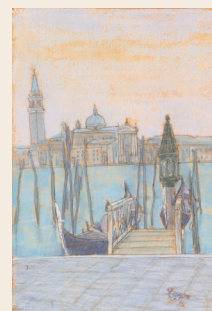
「ベニス風景」1950年代 パステル・紙