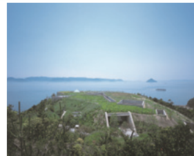
地中美術館