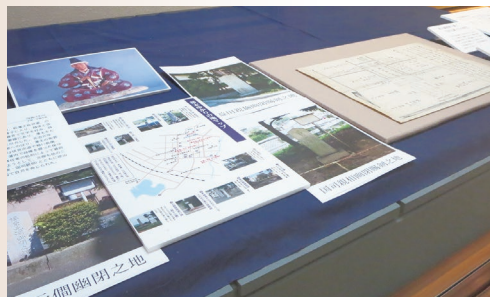
「長州藩三家老首実検之図」

鳥羽・伏見の戦い（戊辰戦争）の錦絵の紹介にはじまり、最後の藩主・元蕃の時代を資料でたどりました。