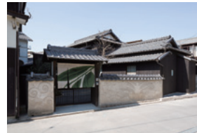
ANDO MUSEUM