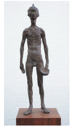
堀口泰造「若い捕虜」