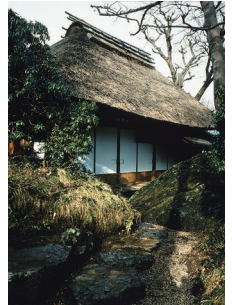
箱根・強羅公園 不染庵 外観

1年をかけて紹介してきた、林忠彦の「茶室」。Ⅳ期は、箱根の強羅公園、金沢の兼六園、東京の根津美術館や岡山美術館の茶室など各地の名席38点です。「茶室」シリーズは、もともと雑誌「婦人画報」に7年間にわたり連載されたものです。建築写真では大型カメラを使って質感をリアルに表現することが多い中、林は茶室に座って感動した瞬間、スピーディーにシャッターを切るために、あえて小型カメラで挑戦したといっています。実際に茶室を訪れたかのような気分になれる作品群です。