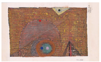
「(タイトルなし)」1961年12月5日