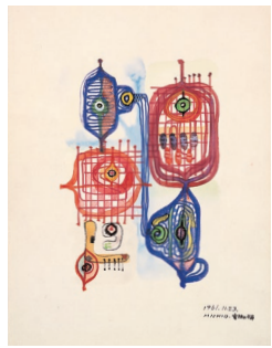
「電話の季節」1961年11月23日

今回展示している作品は、水彩やクレヨン、フェルトペンを使って描かれています。独特の線や形で表現しているものや、紙の上に来るでパレットのように色を塗り重ね、独特の色合いで表現しているものなど。思いつくまま自由に表現された作品をお楽しみください。