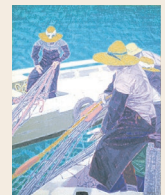
「網船(瀬戸内漁夫)」 1971年 油彩・キャンバス